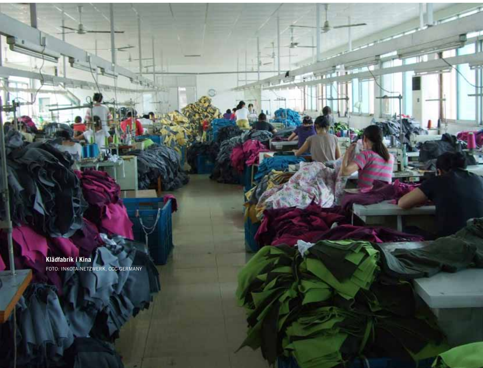
Klädfabrik i Kina

Här följer information om hur de nio modeföretagen arbetar med lönefrågan.